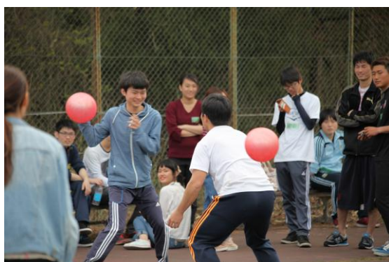
ドッチボール大会の様子

セミナーハウスに到着するとまずドッチボール大会が行われました。先生方も一緒にとっても盛り上がり楽しかったです。その後、卒業生の方の講演会でした。実際に企業で働いておられる先輩の講演を聴くことができ、自分の将来を考えるためにもとても貴重な時間でした。