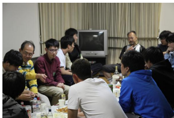
懇親会での先生方との交流

夕食後は懇親会が行われました。1・2回生の自己紹介は先輩方の盛り上げ方が素晴らしくとてもおもしろかったです。その後は各々会話を楽しみました。普段あまり話すことのできない先輩方や先生方とも話すことができ、これからの大学生活への取り組み方などについて相談することができ、とても充実した時間を過ごすことができました。