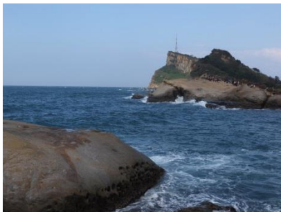
野柳地質公園ークィーンズヘッド